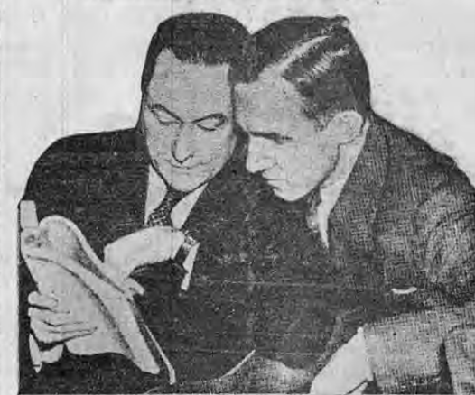
El acusado en compañía de uno de sus abogados. Puede verse en esta foto cómo ha cambiado de expresión últimamente la cara inesorable de Hauptmann.

El juez Trinchard amonesta a Reilly por el incumplimiento de éstos.—Hauptmann, verdadero mago financiero atormentado por una nueva inquisición